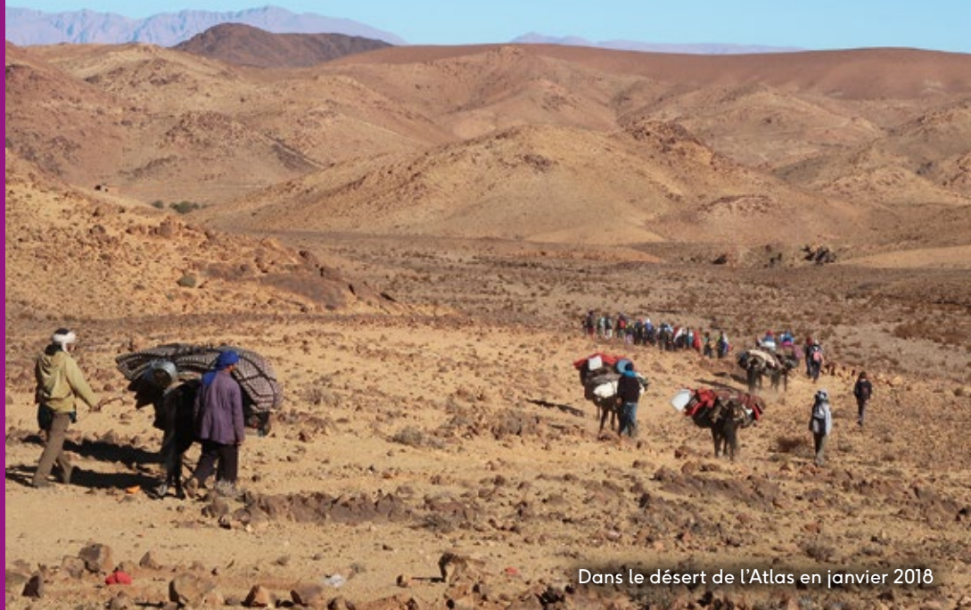
Dans le désert de l'Atlas en janvier 2018