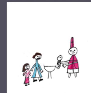
Adélaïde (CE2 - St-Nicolas)