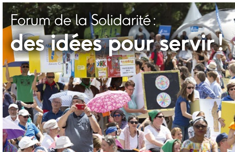
Lors de la journée eucharistique missionnaire - Juin 2017