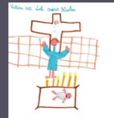
Victoire (CE2 - St-Nicolas)